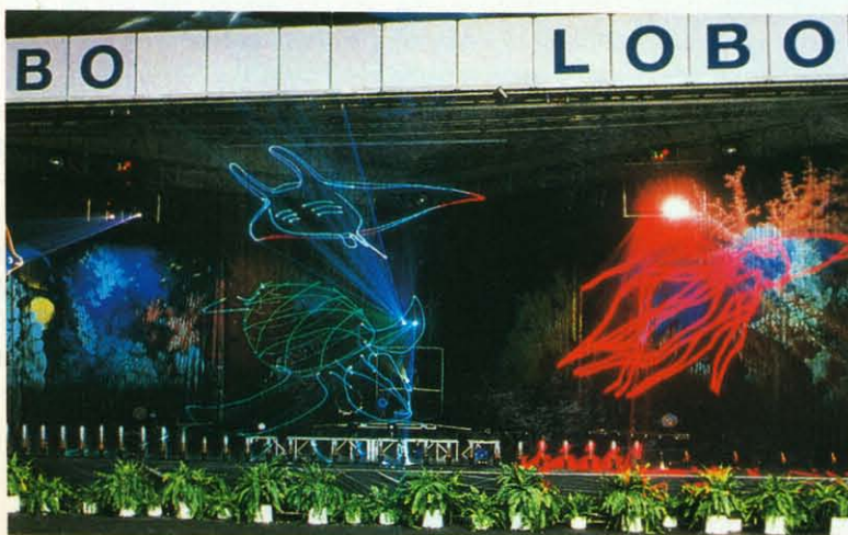
The Lobo stand at Sib'96 trade show, featuring an extraordinary multimedia show.