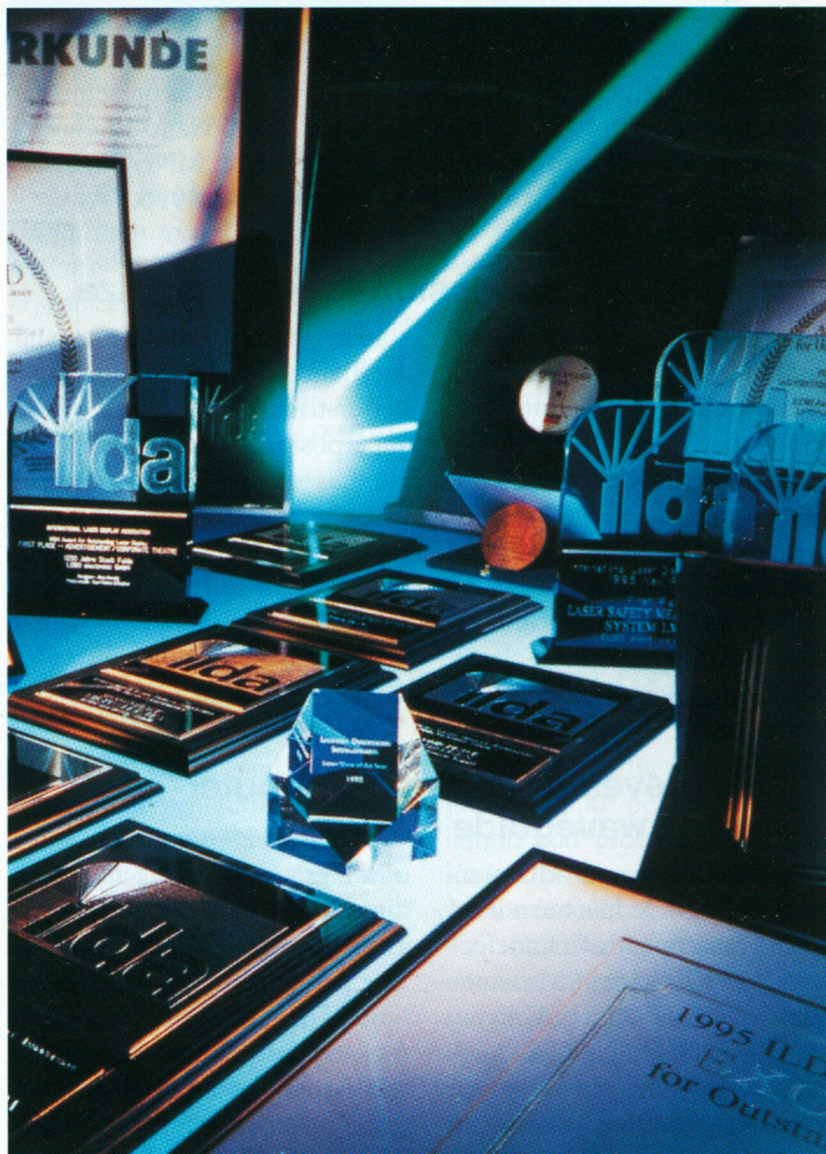
Fast alle wichtigen Auszeichnungen hat LOBO bereits erhalten