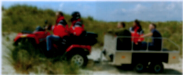
C&S und WAS entwickelt gemeinsam gründergänger Feuerwehrfahrzeuge mit neuartigen Hydraulik und Lüftungstechnik.

an der C&S GmbH in Schwäbisch Gmünd beteiligt. C&S ist spezialisiert auf den Bau von kleinen, hochgründegängigen Fahrzeugen für Ambulanz- und Feuerwehranwendungen. Zum Angebot gehören Quads, die