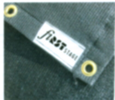
Planen nach Maß liefert RST.

Info (0 23 31) 69 15 00 www.rstdistribution.de