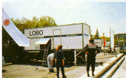
Der LOBO Laser Truck - die größte mobile Laseranlage der Welt

Die beeindruckenden Video- und Diacollagen erzeugten ein Videobeamer und acht Xenon-Projektoren auf vier asymmetrische Leinwände. Um den Saal in stimmungsvolles Licht zu tauchen, wurden hunderte Scheinwerfer über die gesamte Veranstaltungsfläche hinweg an eine asymmetrisch ausgerichtete Traversenlandschaft gehängt. LOBO baute vor Ort einen Laser Truck auf, der videoüberwacht fünf kompakte, glasfaserversorgte Projektoren mit maximal 57 Watt Laserlicht versorgte. Um das Gewirr von Laserstrahlen um die Fertigungsstraße zu realisieren, wurden im Raum insgesamt 60 Spiegel platziert.