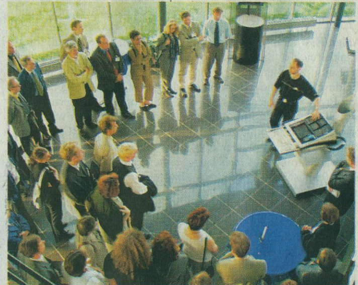
Gruppenweise wurden die Gäste in die Lasertechnik eingeführt.