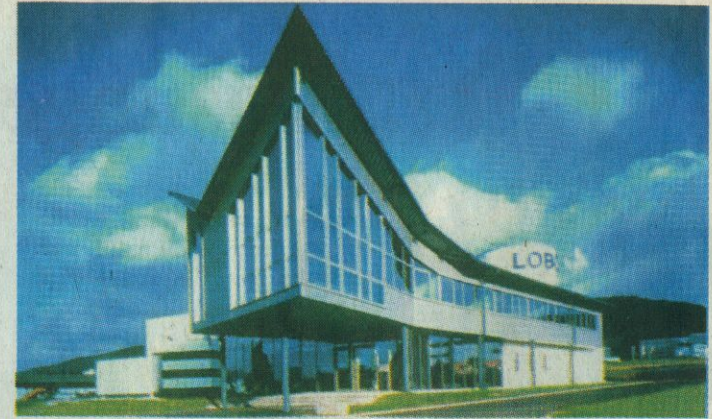
Das neue Firmengebäude von LOBO im Dauerwang.

den Produktionsablauf bestimmt und als Kalkulationsgrundlage dient. Highlight des abendlichen Treffens war jedoch die Vorführung zweier Multimediashows im futuristisch eingerichteten Laser-Showroom. Hier bekamen die staunenden Gäste die „Chronology“ der Menschheit und einen Ausschnitt der baldigen Expo-Präsentation zu sehen. Die LOBO electronic GmbH, 1982 gegründet, gilt in Fachkreisen als Weltmarktführer sowohl im Hard- und Software- als auch im Event-Bereich. Für die Entwicklung einer RGB-Farbmischeinheit hat das Unternehmen 1992 den Innovationspreis des Landes Baden-Württemberg bekommen. Mit zahlreichen Shows und Produktpräsentationen im In- und Ausland hat sich LOBO weltweit an die Spitze vorgearbeitet und Standards gesetzt. Die nächste Club-Veranstaltung findet nach Pfingsten beim SDZ in Aalen statt.