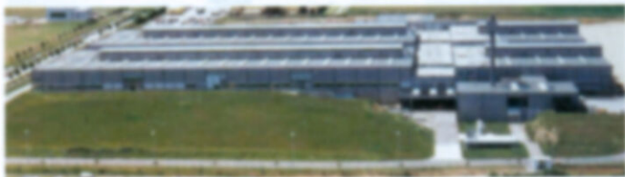
ZF Lenksysteme auf dem Gügling. Täglich verlassen 18.500 Ventile für Lenkungen das Werk.

Die Übergabe des Preises wird im Rahmen einer Tagung im Februar 2002 stattfinden. Zu dieser Tagung, die im Stadtgarten in Schwäbisch Gmünd stattfinden wird, werden annähernd 250 Produktionsspezialisten aus ganz Deutschland erwartet. ■