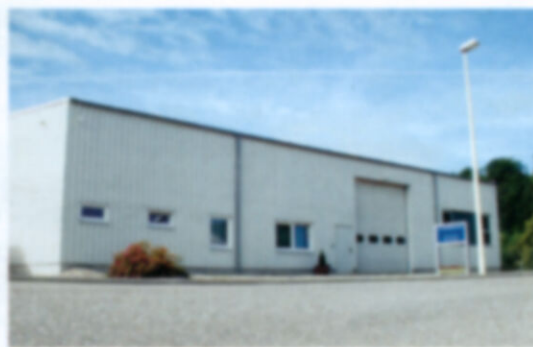
Betriebsgebäude der Nelken-Niederlassung in Heidenheim-Mergelstetten.

Im Jahr des 100jährigen Firmenjubiläums feiert die Niederlassung Heidenheim der Dr. Ewald Nelken GmbH in Mühlheim/Ruhr ihr zehnjähriges Bestehen. Das Unternehmen beschäftigt sich überwiegend mit der Produktion und dem Service von wassergekühlten Induktoren