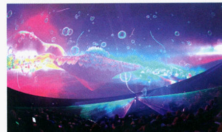
Ausgezeichnet wurde das einzigartige Lasersicherheitskonzept im Science Dome der experimenta in Heilbronn.

formance zu gewährleisten, haben die Aalener ein ausgeklügeltes und einzigartiges Lasersicherheitskonzept entwickelt: Integriert in das Prinzip des von LOBO entwickelten Digital Data Link (kurz DDL®) wurden im Bereich der Laserprojektoren sogenannte LIDAR-Sensoren installiert, die als Lasersicherheitsscanner fungieren. Diese senden einen flachen, unsichtbaren Infrarot-Laserfächer, welche die Distanz zu möglichen Hindernissen abtastet – sollte zum Beispiel ein Zuschauer, der seinen an sich sicheren Platz während einer Show verlässt, einen dieser Sensoren auslösen, werden automatisch in kürzester Zeit die Laser-