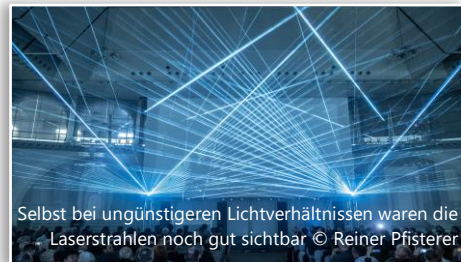
Selbst bei ungünstigeren Lichtverhältnissen waren die Laserstrahlen noch gut sichtbar