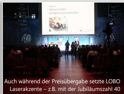
Auch während der Preisübergabe setzte LOBO Laserakzente – z.B. mit der Jubiläumszahl 40