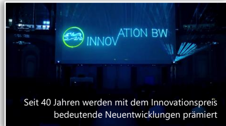
Seit 40 Jahren werden mit dem Innovationspreis bedeutende Neuentwicklungen prämiert