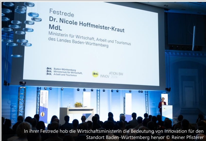
In ihrer Festrede hob die Wirtschaftsministerin die Bedeutung von Innovation für den Standort Baden-Württemberg hervor