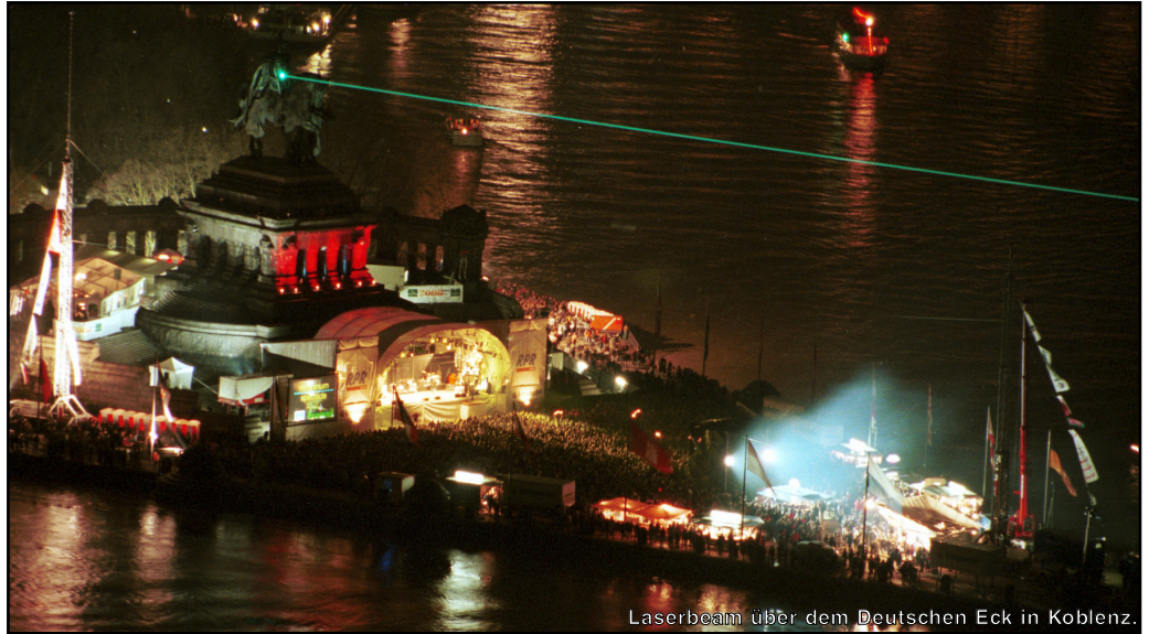
Laserbeam über dem Deutschen Eck in Koblenz.

Deutsches Eck, Koblenz. Schon seit der Dämmerung schwebt über dem Veranstaltungsort ein gigantisches Strahlenbündel, das die berühmtesten Bauwerke der Stadt untereinander verbindet. Kurz vor Mitternacht blicken die sich am Rheinufer drängenden Menschenmassen wie gebannt zu dem auf der anderen Rheinseite liegenden Felsen unterhalb der Burg Ehrenbreitstein. Diese natürliche Kulisse nutzten die aalener Laserspezialisten als gigantische Projektionsfläche für den Countdown ins Jahr 2000.