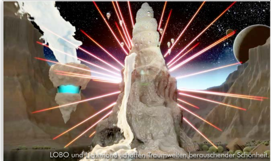
LOBO und Lichtmond schaffen Traumwelten berauscher Schönheit.